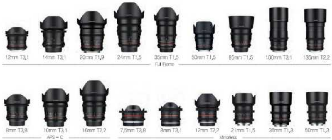
Cine 렌즈(일부 기종 제외)