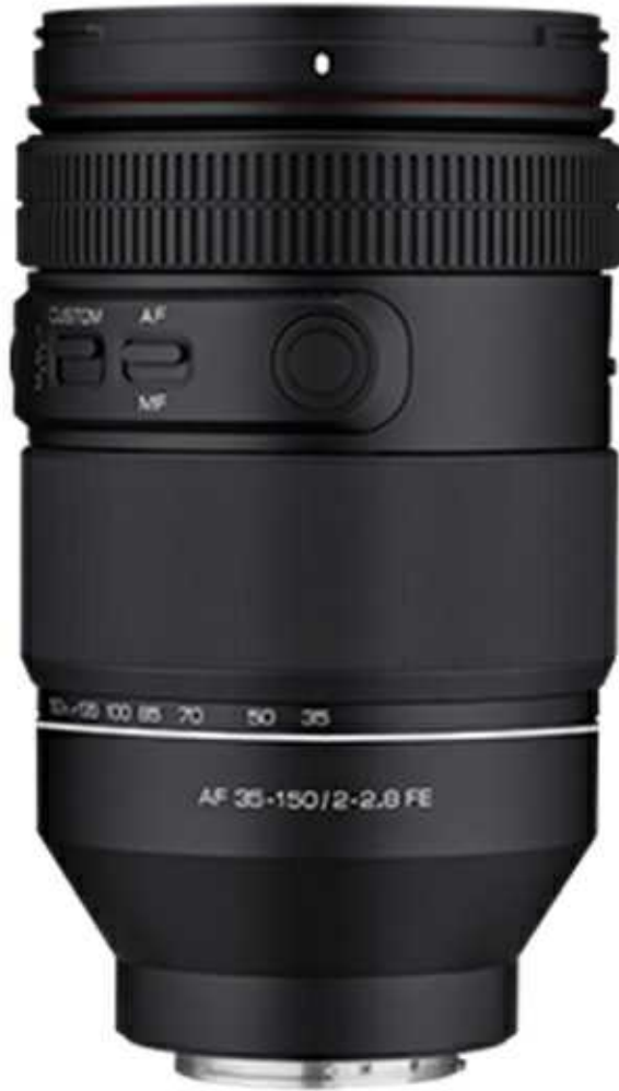
AF 35-150mm F2.0-2.8 FE 렌즈

당사의 두번째 자동초점 줌 렌즈인 AF 35-150mm F2.0-2.8 FE 렌즈는 광각(35mm)부터 망원(150mm)까지의 화각을 모두 커버하는 대구경 줌 렌즈로, 동영상 촬영을 위한 특화 기능이 추가되어 있어 단 하나의 렌즈로 전문적인 사진과 동영상 촬영이 가능합니다. 또한 빠르고 정확한 STM 모터가 채용되어 카메라 바디에서 제공하는 눈동자 및 얼굴 추적 총 21매 렌즈 중 12매에 특수 렌즈를 사용하여 우수한 해상력의 사진과 동영상을 촬영할 수 있으며, 웨더실링 설계로 가벼운 먼지, 손상이나 오염을 방지할 수 있습니다.