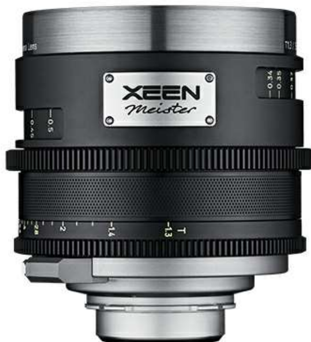
XEEN MEISTER 렌즈

XEEN Meister 렌즈는 Cine 렌즈 중 가장 밝은 T1.3 조리개를 가지고 있는 고성능의 프라임 렌즈로, 최신 디지털 시네마 카메라에 탑재된 F/F 이미지 센서에 대응합니다. 렌즈 외관에 티타늄을 적용해 견고함을 높이고 고급스러운 디자인을 제공합니다. 다양한 촬영 환경에도 유연하게 대응하며, PL 마운트에는 /i 기능을 탑재하여 렌즈의 데이터를 확인, 저장이 가능합니다. 또한 8K를 지원하는 뛰어난 해상력과 독자적인 X-Coating 기술을 통해 인물의 섬세한 감정을 담아내는 풍부한 표현력을 보여줍니다.