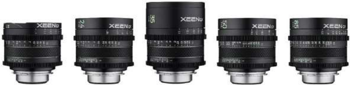
XEEN CF 렌즈

XEEN CF 렌즈는 대형 이미지센서에 대응하는 초경량 & 고성능의 시네 프라임 렌즈로, 최신 디지털 시네마 카메라에 탑재된 대형 이미지센서에 대응하면서도, 영상 장비의 소형, 경량화 트렌드에 맞춰 작고 가볍게 설계되었습니다.