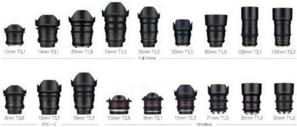
Cine 렌즈 현황(일부 기종 제외)