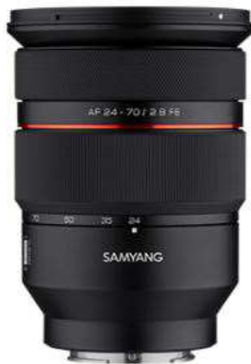
AF 24-70mm F2.8 FE

삼양 최초의 AF 줌렌즈로서 일반 표준 줌렌즈와 다르게 동영상 촬영에 특화된 기능이 추가되어 있습니다. 또한 빠르고 정확한 STM모터가 도입되어 카메라 바디에서 제공하는 눈동자 및 얼굴 추적 촬영에도 대응합니다. 총 17매 렌즈 중 9매에 특수 렌