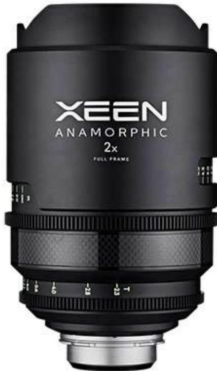
XEEN ANARMORPHIC 렌즈

XEEN ANAMORPHIC 렌즈는 하이엔드 디지털 프로덕션 환경에 최적화된 풀프레임 센서를 채용한 PL마운트 카메라에 대응합니다. 우수한 선명도를 제공하며 4K나 UHD 뿐만 아니라 8K 해상도 카메라에도 적합합니다. 35mm 풀프레임 센서 카메라로 촬영 시, 좌우가 2배 늘어난 2.55:1의 시네마틱 비율로 촬영이 가능하며 보다 넓은 시야를 제공할 뿐만 아니라 옛날 영화만의 빈티지한 감성과 수평화각에서 더욱 웅장하고 매력적인 영상을 제공합니다.