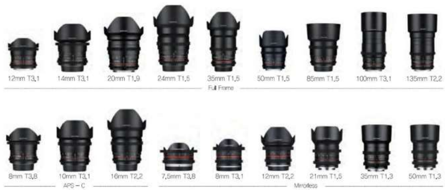
Cine 렌즈 현황(일부 기종 제외)