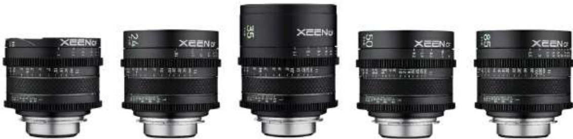
XEEN CF 렌즈

XEEN CF 렌즈는 대형 이미지센서에 대응하는 초경량 & 고성능의 시네 프라임 렌즈로, 최신 디지털 시네마 카메라에 탑재된 대형 이미지센서에 대응하면서도, 영상 장비의 소형, 경량화 트렌드에 맞춰 작고 가볍게 설계되었습니다.