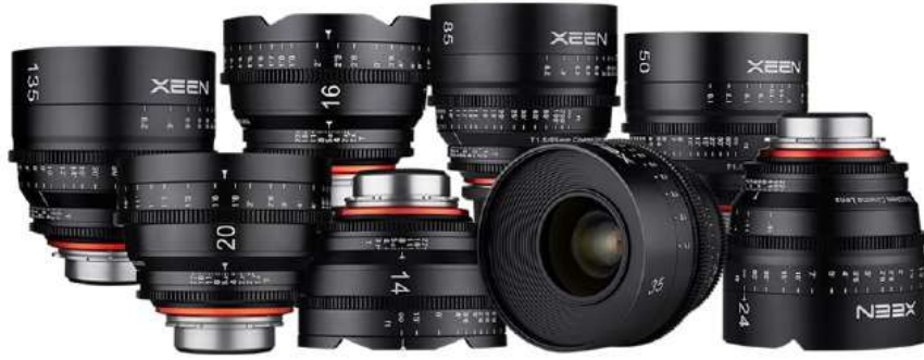
Pro-cine 렌즈 (XEEN)

당사는 제품군을 소비자의 사용목적에 맞게 Photo 용과 Cine 용으로 이원화하여 소비자의 다양한 니즈를 충족시키면서, 한편으로는 Cine 용 제품군을 일반소비자와 상업적 전문가용으로 구분하여 제품을 개발, 출시함으로써 성공적으로 시장의 선점과 전문 브랜드 이미지 확보를 실현해 가고 있습니다. 특히 2015년에는 국내에서는 최초로, 해외에서도 선진국의 소수의 전문업체만 제조하는 동영상용 전문렌즈를 당사가 “ XEEN” 이라는 이름으로 출시하였으며, 해외 각국으로부터 전문가들의 호평이 이어지고 있으며 한국 Good Design ('15.12월), 독일 RedDot Design Award ('18.4월) 등을 수상하였습니다.